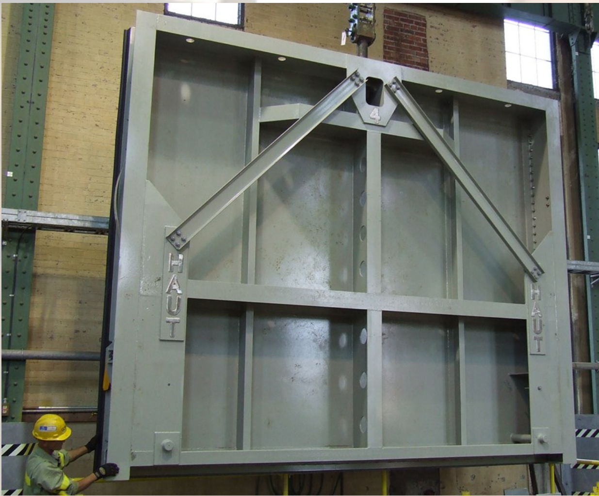
Nouvelle vanne batardeau section supérieure (1 de 4)