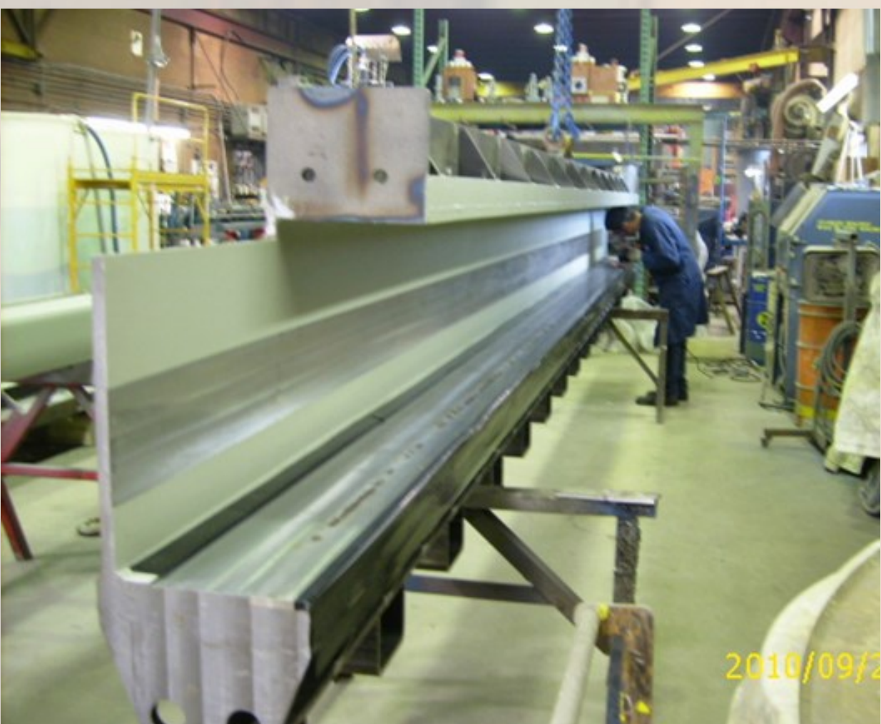
Nouvelles pièces encastrées